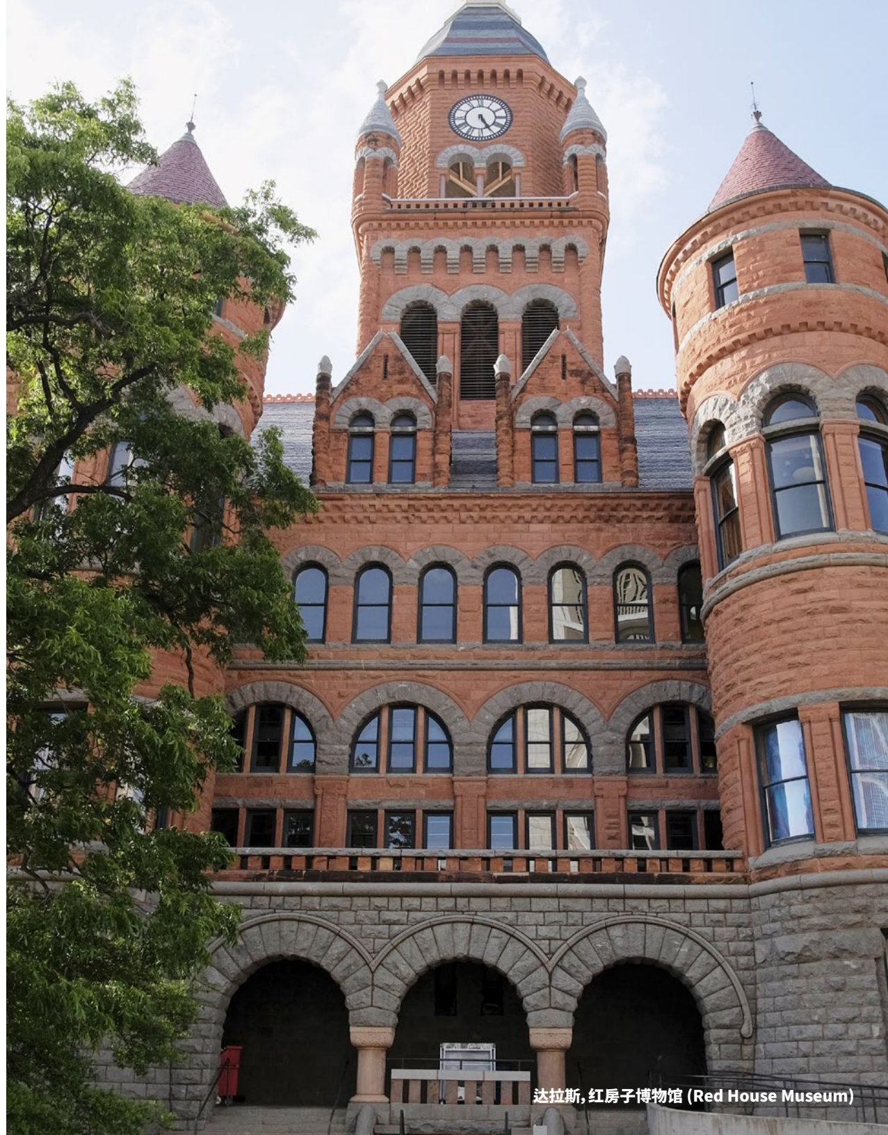
达拉斯, 红房子博物馆 (Red House Museum)

达拉斯/沃思堡国际机场 ( Dallas-Fort Worth International Airport ) 北侧的格雷普韦恩米尔斯购物中心 ( Grapevine Mills ) 聚集了 180 多家商店, 包括真实信仰奥特莱斯、安德玛、 The Children's Place 、西尔斯奥特莱斯、彪马奥特莱斯、老海军奥特莱斯、 OshKosh B'gosh 、耐克工厂店和尼曼·马库斯清仓折扣百货。从购物中抽身出来, 不妨到 Chuck E. Cheese's 、 Rainforest Café 或 Great Wraps 等餐厅品尝美食, 补充体力。这座购物中心内还设有格雷普韦恩海洋生物水族馆 ( Sea Life Grapevine Aquarium ) 和乐高探索中心 ( LEGOLAND Discovery Center ), 以及小火车和旋转木马等游乐设施。最后, 可以沿着格雷普韦恩都市品酒路线 ( Grapevine Urban Wine Trail ) 游览, 去 Cross Timbers Winery 和 Grape Vine Springs Winery 等酒庄品尝各种葡萄酒。