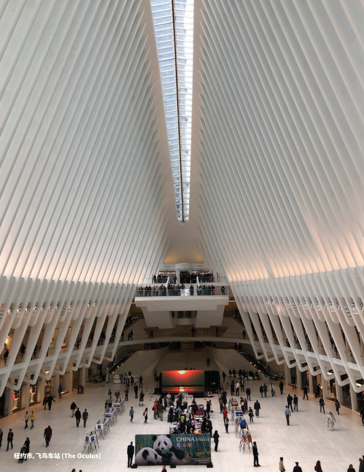
纽约市, 飞鸟车站 (The Oculus)