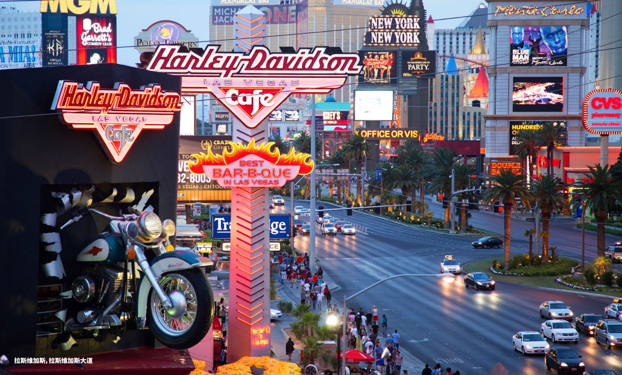
拉斯维加斯, 拉斯维加斯大道