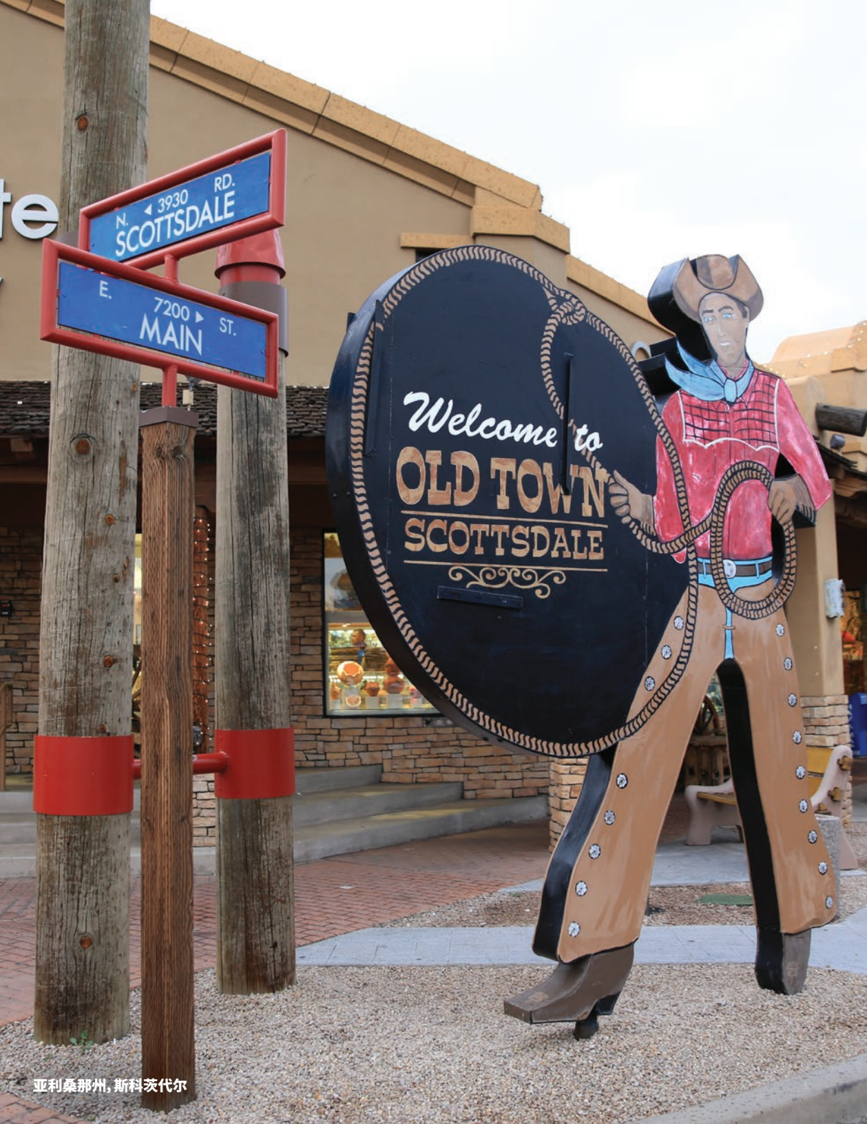
亚利桑那州, 斯科茨代尔