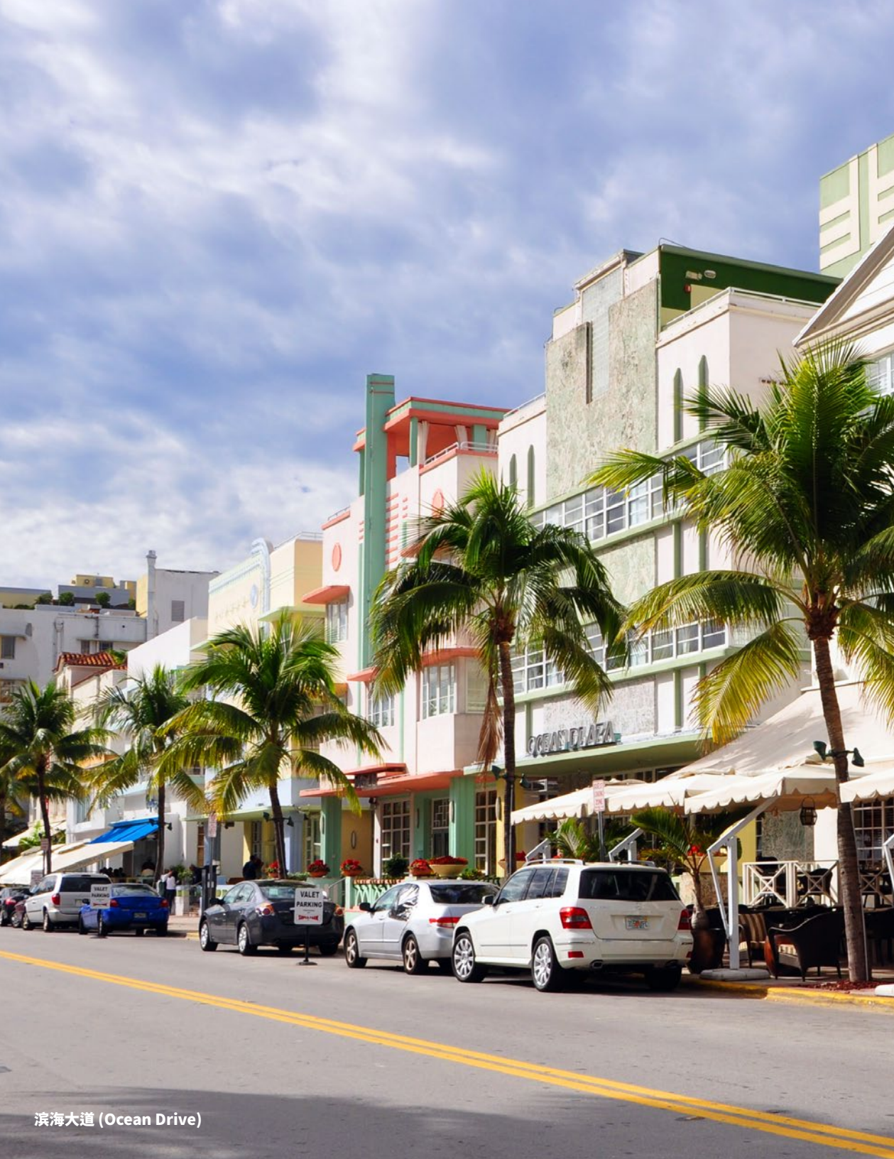
滨海大道 (Ocean Drive)