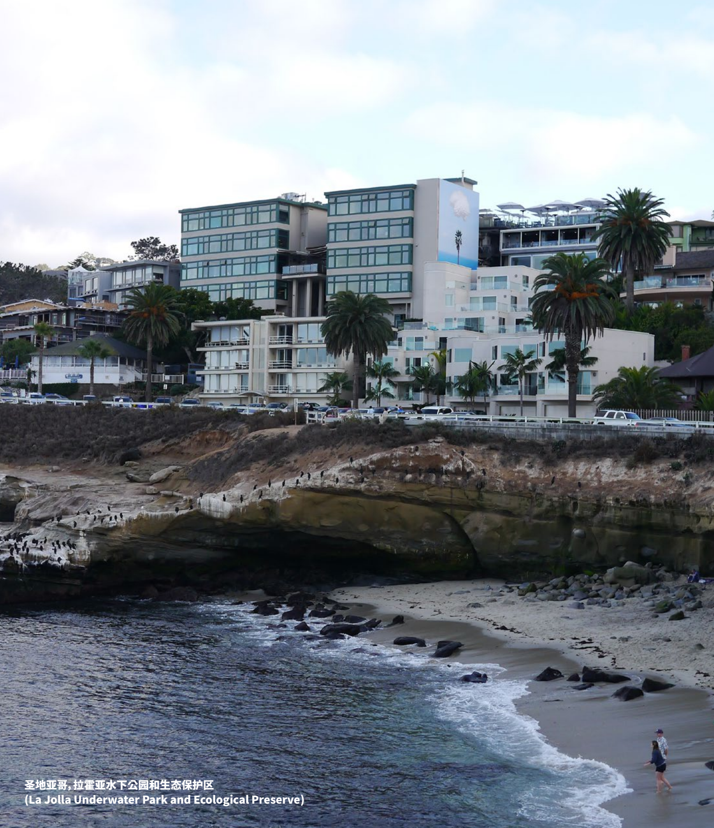
圣地亚哥, 拉霍亚水下公园和生态保护区 (La Jolla Underwater Park and Ecological Preserve)