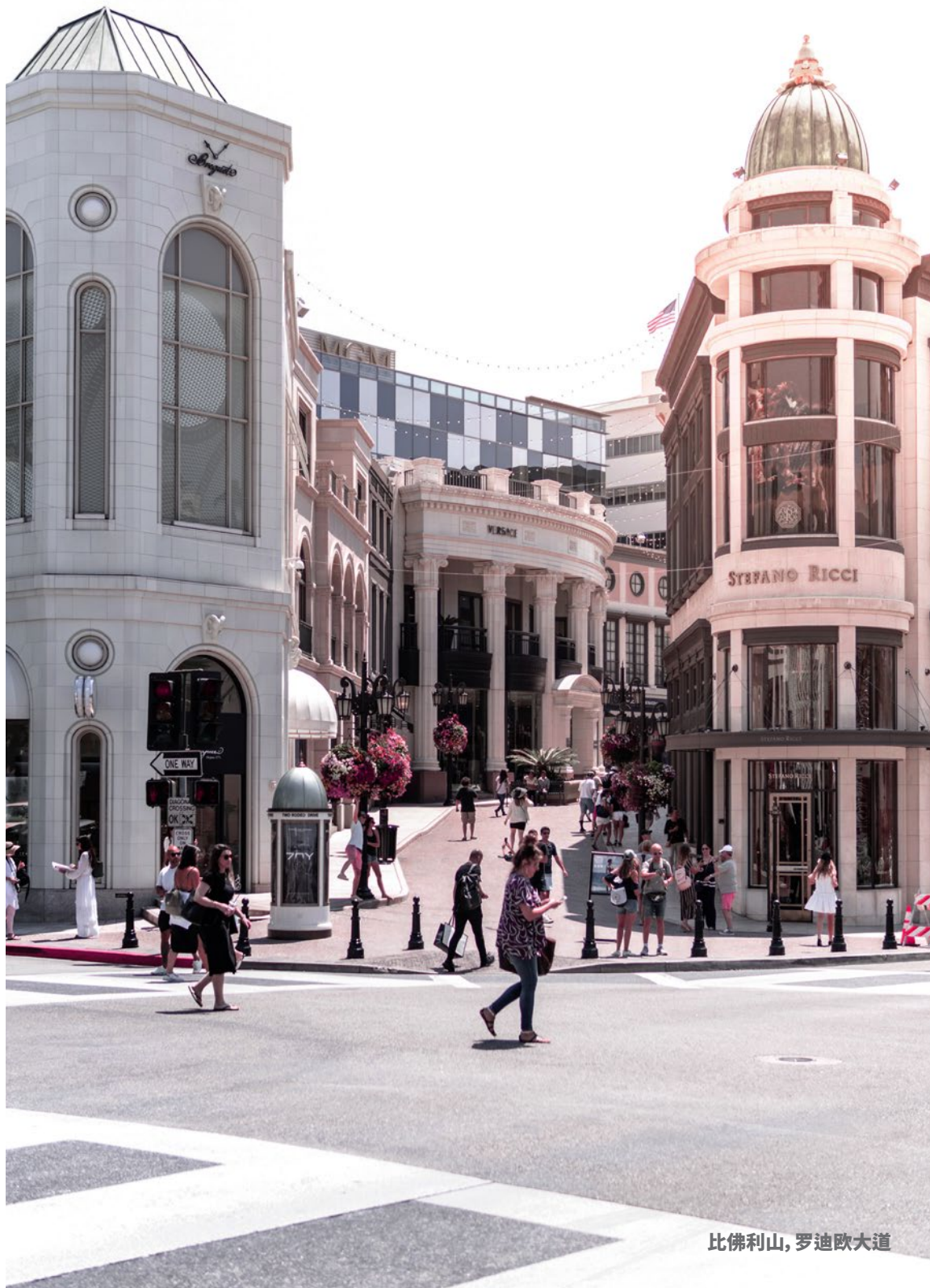
比佛利山，罗迪欧大道

今天，让自己沉浸在好莱坞的所有精彩之中。前往好莱坞高地中心 ( Hollywood & Highland )，选购幸运牌 ( Lucky Brand )、PINK、维多利亚的秘密 ( Victoria's Secret ) 和魅可等品牌。参观奥斯卡金像奖的举办场地杜比剧院 ( Dolby Theatre )，然后漫步于好莱坞大道 ( Hollywood Boulevard )，参观好莱坞星光大道 ( Hollywood Walk of Fame ) 和中国大剧院 ( Grauman's Chinese Theatre )。沿着圣莫尼卡大道 ( Santa Monica Boulevard ) 前往西田世纪城购物中心 ( Westfield Century City )，这里最近刚刚斥资 10 亿美元进行了改造。购物中心内聚集了 200 多家商店，包括苹果商店、亚马逊书店 ( Amazon Books )、Bonobos、祖·玛珑、阿贝克隆比&费奇 ( Abercrombie & Fitch )、约翰·哈迪 ( John Hardy )、泰德·贝克 ( Ted Baker )、J.Crew 和微软商城 ( Microsoft Store ) 等。然后前往 Eataly 餐厅，或者是 Shake Shack 、 Tipsy Cow 和 Big Fish Little Fish 等顶级餐厅品尝美食。购物中心的户外中庭区域提供音乐会、百老汇演出和其他活动。驱车向西往太平洋方向，到达圣莫尼卡广场 ( Santa Monica Place )，这座三层楼的商城内聚集着巴尼斯纽约精品店 ( Barneys New York )、凯特·丝蓓纽约 ( Kate Spade New York )、蒂芙尼·黛安·冯芙丝汀宝 ( Diane Von Furstenberg )、迪士尼商店和耐克等品牌。如果觉得累了，可以去圣莫尼卡码头休息一会儿，去骑一骑古老的 Looff Hippodrome Carousel 旋转木马或者去参观圣莫尼卡码头水族馆 ( Santa Monica Pier Aquarium )。如果觉得饿了，圣莫尼卡还有很多餐厅，但其中备受青睐的休闲海滨餐厅当属 Big Dean's Ocean Front Café 咖啡厅。如果想要感受一下更加正式的用餐体验，那么 Water Grill 烧烤店会是不错的选择。