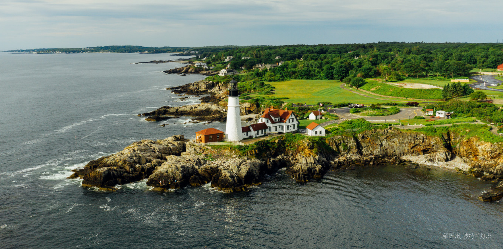
缅因州, 波特兰灯塔