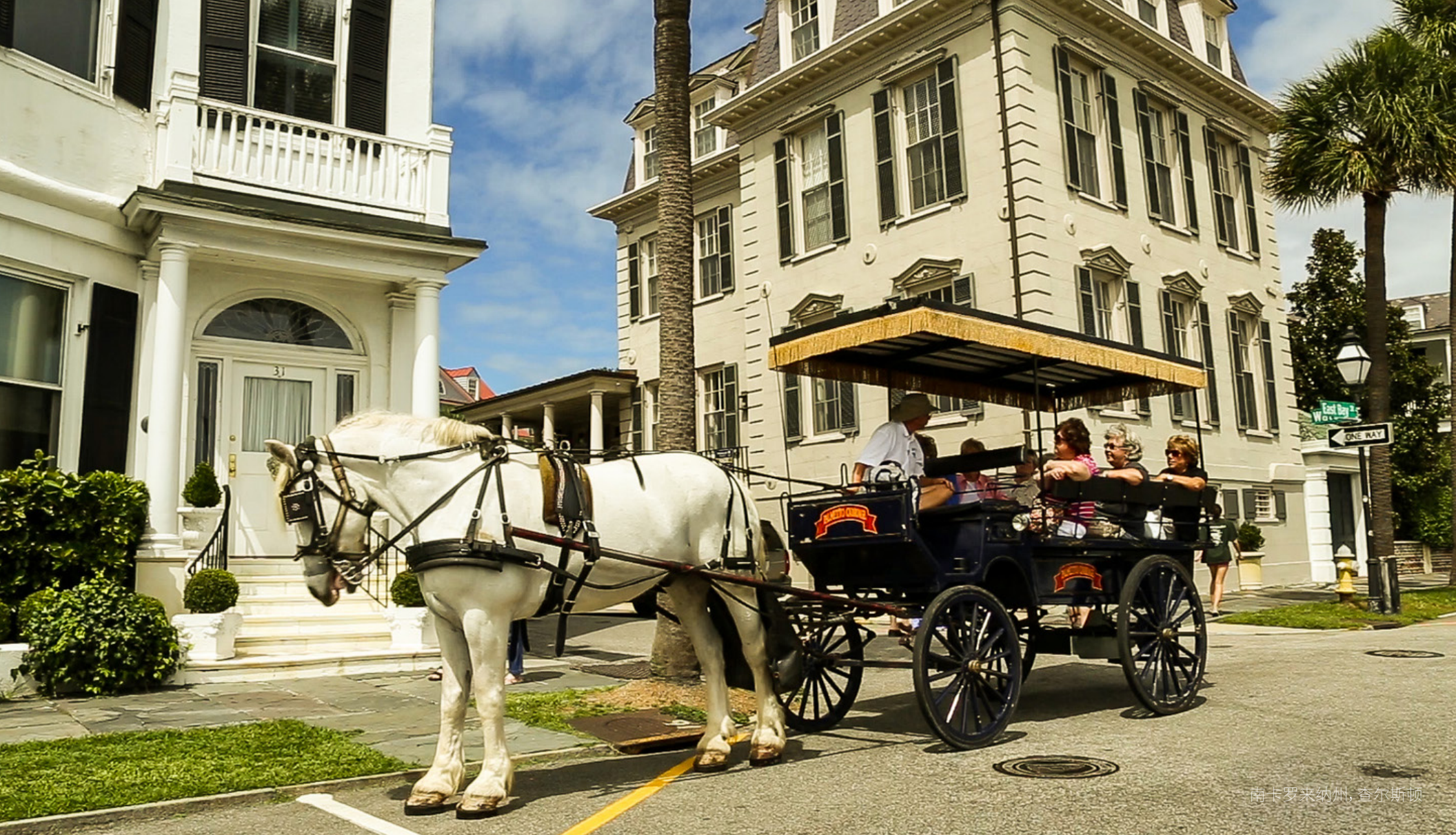
南卡罗来纳州, 查尔斯顿