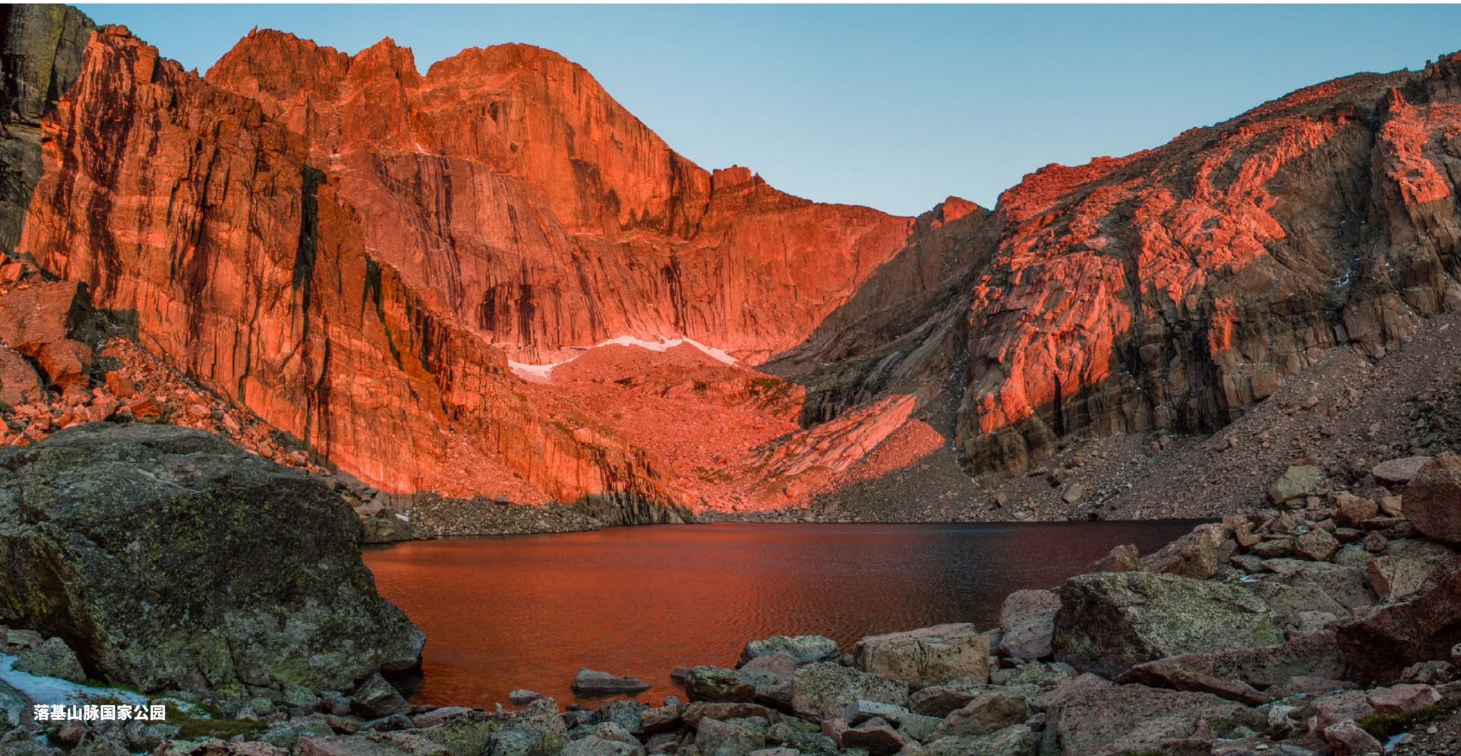
落基山脉国家公园