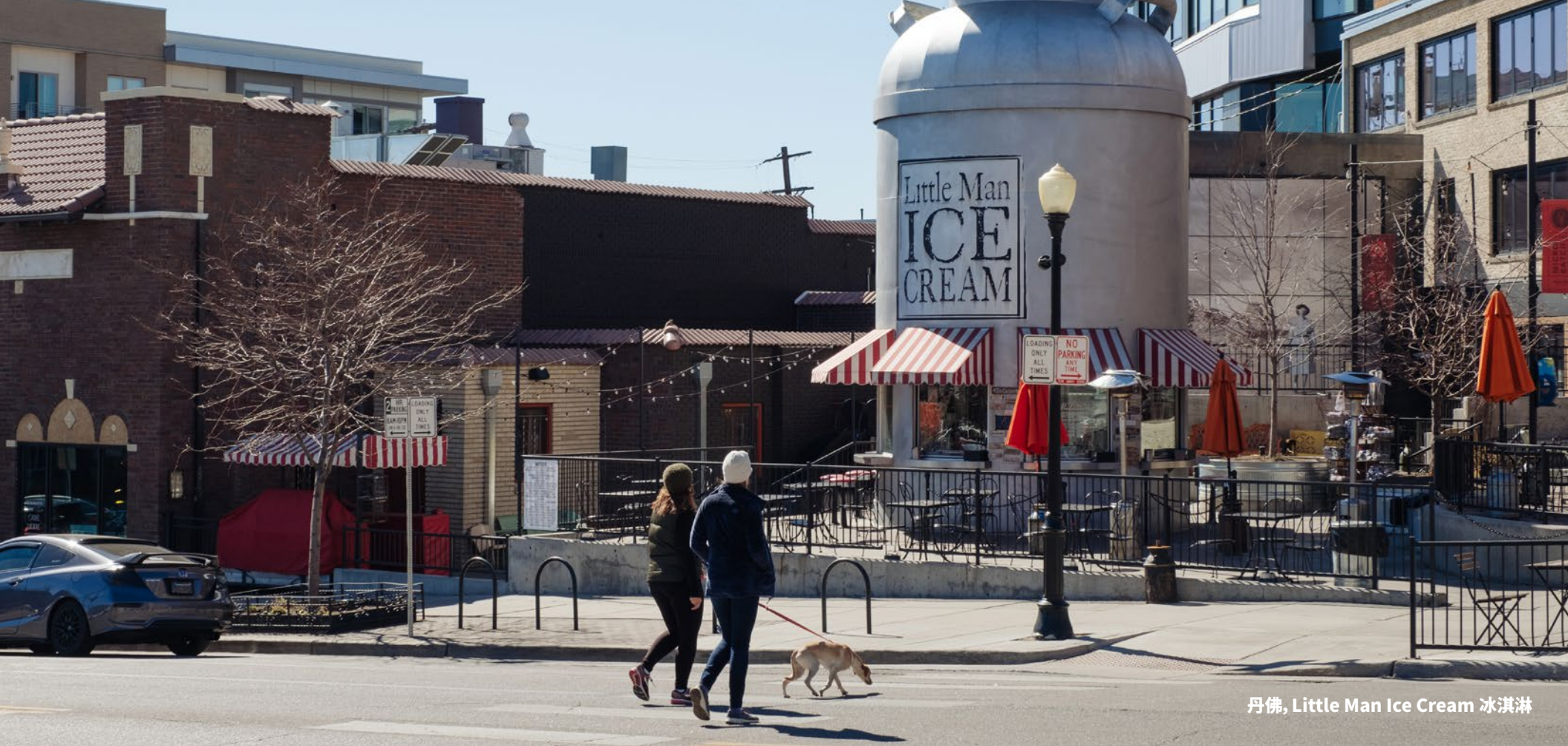
丹佛, Little Man Ice Cream 冰淇淋