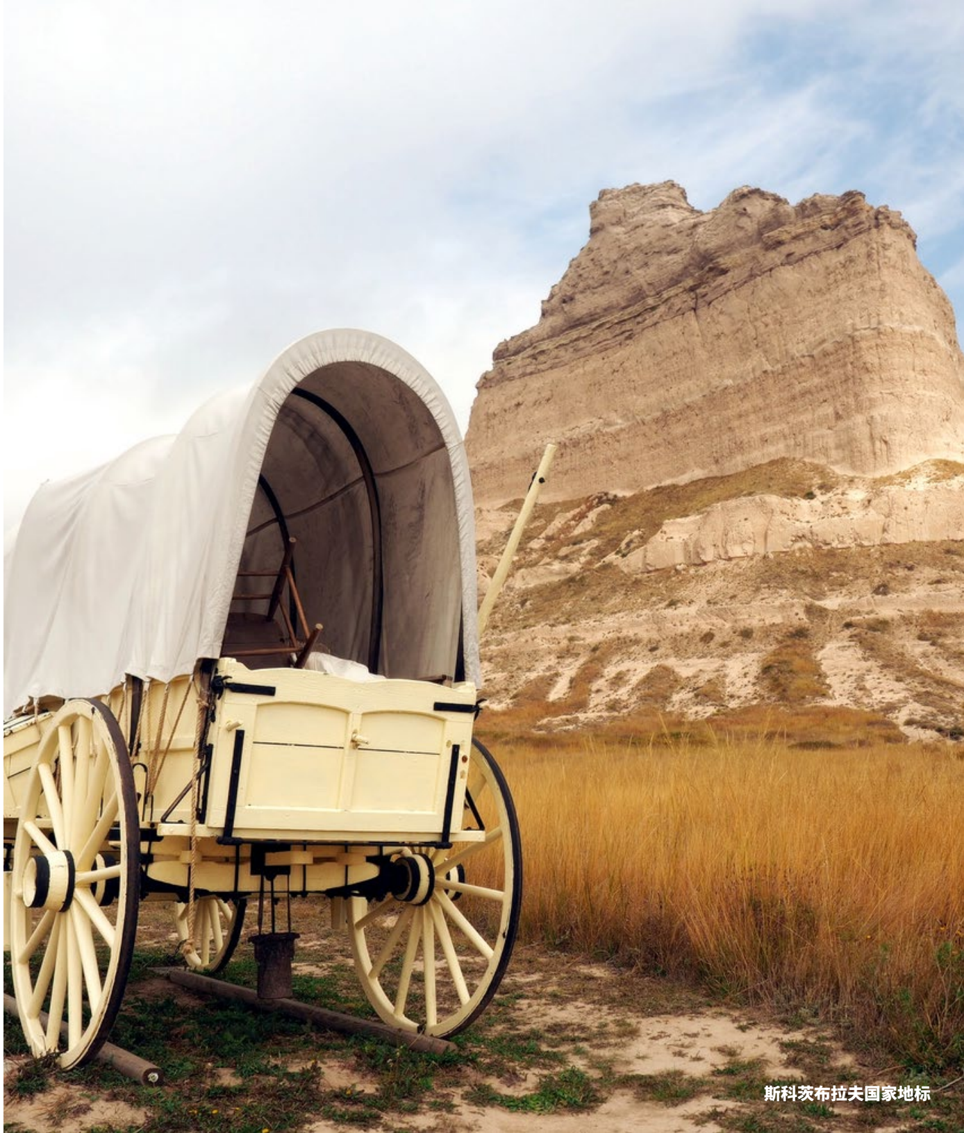
斯科茨布拉夫国家地标