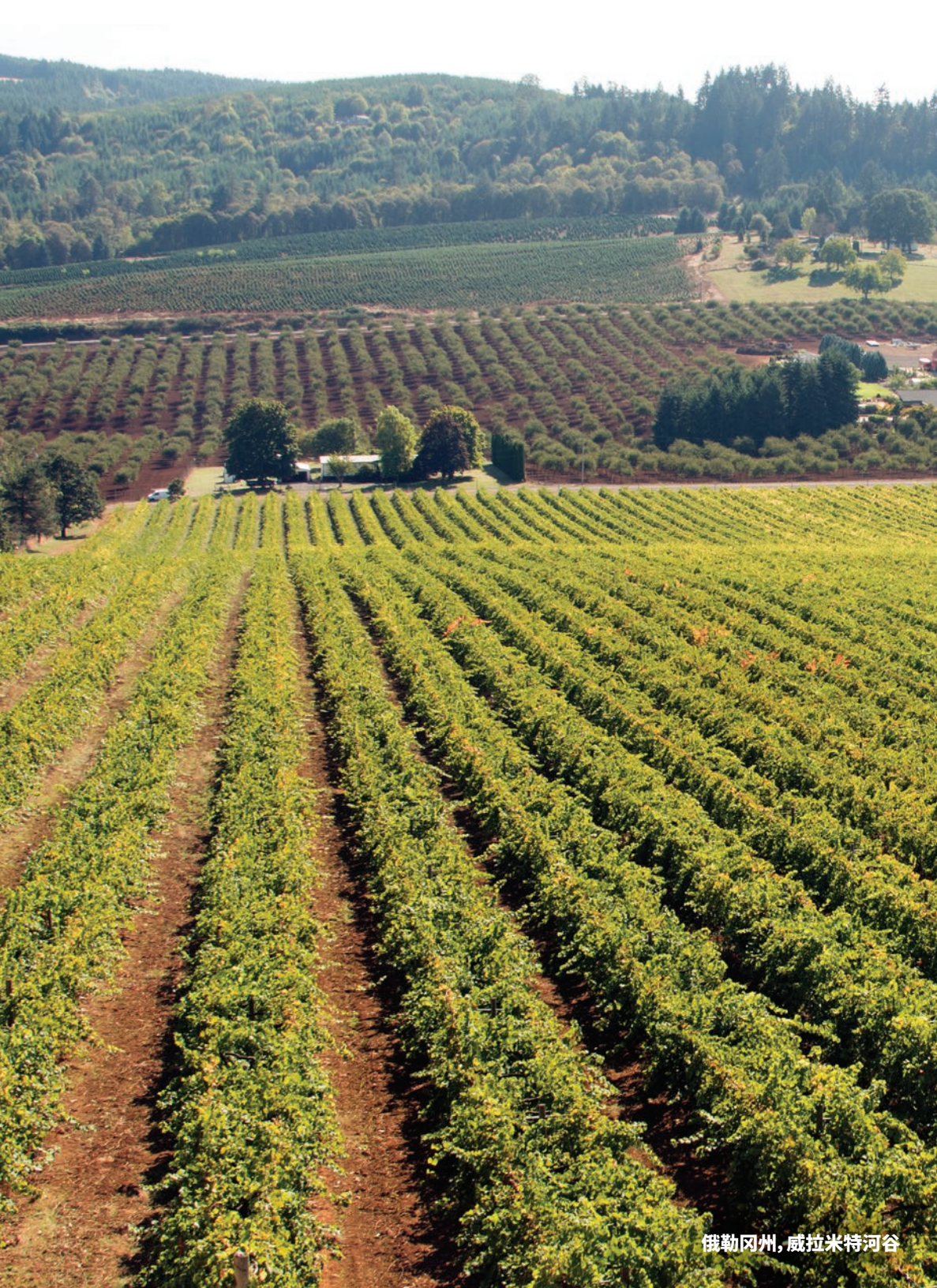
俄勒冈州，威拉米特河谷