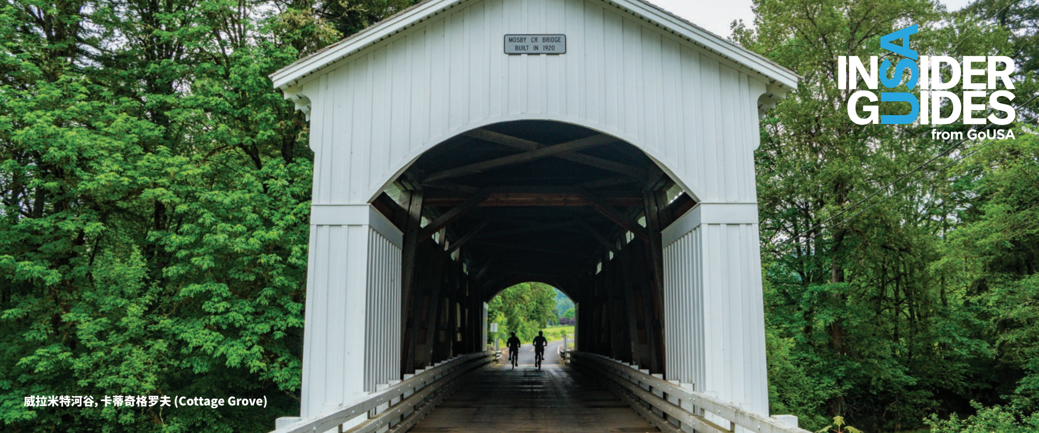
威拉米特河谷, 卡蒂奇格罗夫 (Cottage Grove)